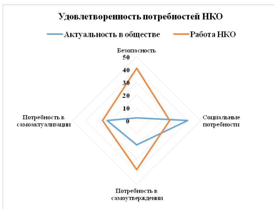
Рисунок 3. Потребности общества и работа НКО по данному направлению

Проблемой также является избирательная поддержка программ НКО государством, финансирование социально ориентированных НКО, расширяет данное направление, но при этом некоммерческие организации, работающие в других сферах, не могут получить должного финансирования из бюджета страны.