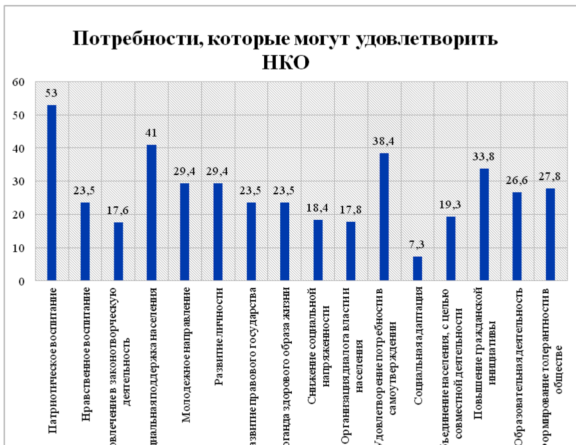
Рисунок 2. Потребности населения, удовлетворяемые НКО

различных некоммерческих организаций, что позволило выделить, на удовлетворение каких потребностей направлена их деятельность.